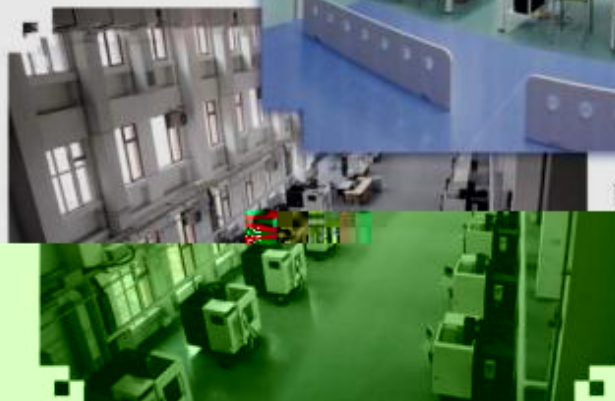
DMG 数控技术训练场所