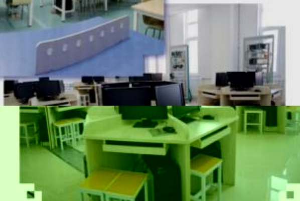
一体化课程教学设计综合实训室