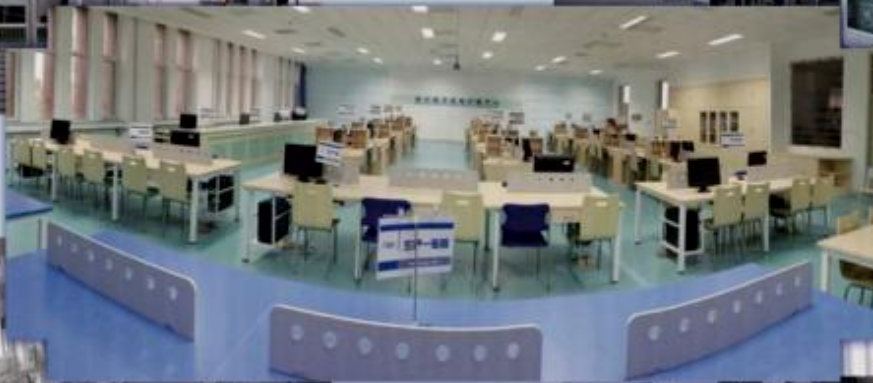
商贸管理类专业综合训练场所